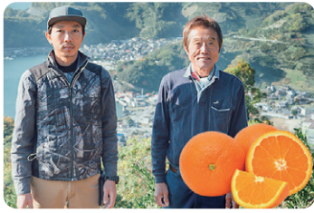
夕焼け山農園 柑橘、柑橘詰め合わせ