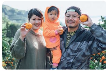
浜のみかん屋 柑橘（みかん、伊予柑など）、柑橘加工品