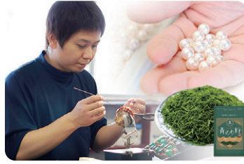
佐藤真珠株式会社 明浜産真珠を使ったアクセサリー、青のり