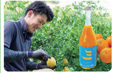
川越農園 柑橘加工品