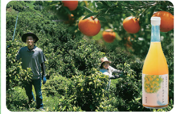
段畑みかん株式会社 柑橘（みかん、ポンカンなど）