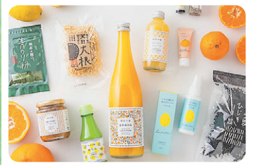
株式会社地域法人 無茶々園 柑橘、加工品、スキンケア用品