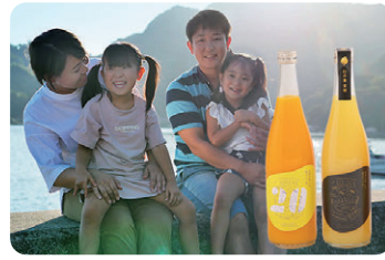
二ノ宮商事株式会社 魚・柑橘加工品