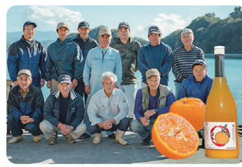
渡江から一步を踏み出す会 柑橘、柑橘加工品