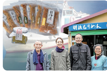
今市水産 無添加ちりめん、海産物、加工品