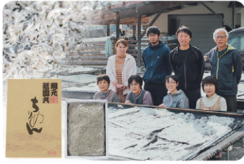
株式会社 網元・祇園丸 食品添加物不使用のちりめん、しらす