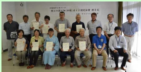
検定試験合格者の皆さんと

前号でご案内しておりました「段々畑のガイドさん」の養成講座が終了し、西予ジオパークの中では最大規模となる13名の中核ガイドさんが狩江に誕生しました。(拍手)